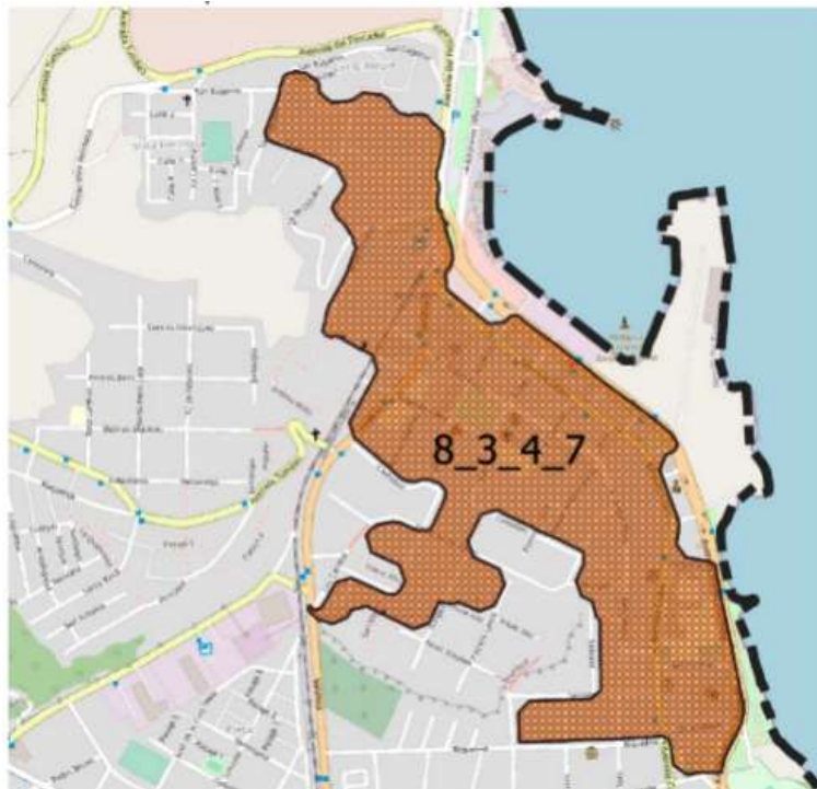
Figura N°2: Prioridad según Metodología Alternativa de Problemas a Nivel Barrial (Ejemplo de Concentración de Robos e Incivildades en un Barrio Comercial).