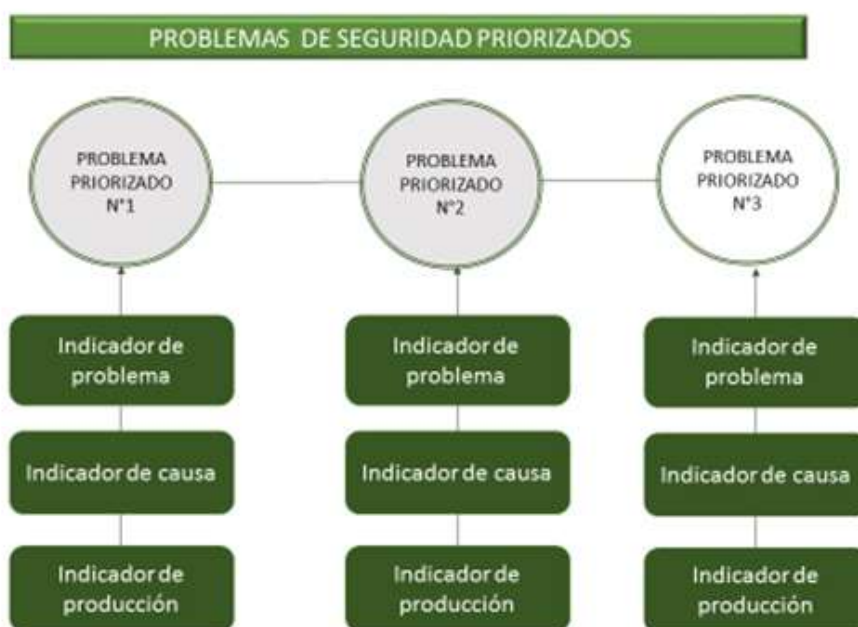
Figura N°5: Propuesta de Diagrama de Cuentas Públicas