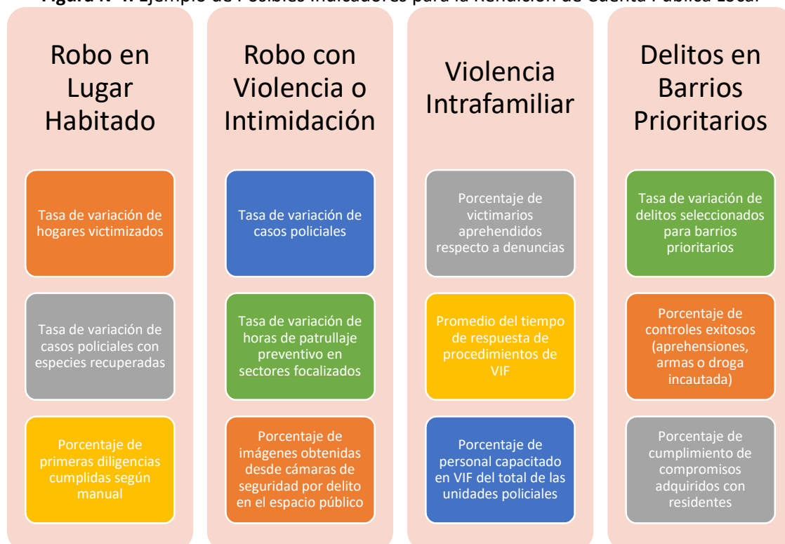
Figura N°4: Ejemplo de Posibles Indicadores para la Rendición de Cuenta Pública Local